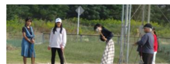
グラウンドゴルフの様子↑