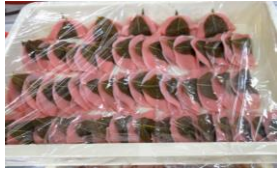
生活部さんたちが桜餅を作っていました

今年の桜まつりは「渡小学校お茶クラブ」の児童にお点前を披露していただき、「大正琴サークル」さんの素晴らしい演奏を楽しみました。また桜餅づくりやお運びさんで「生活部」の皆さんと「三中生有志ボランティア」の皆さん、運営や会場設営等に「公運審」皆さんが花を添えて下さいました。たくさんの皆さんにご協力いただき、ありがとうございました。