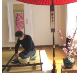
←お茶クラブ師範 →3中ボランティア