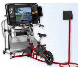
<自転車シミュレーター>