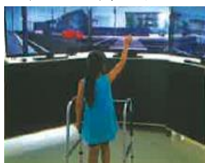
<歩行環境シミュレーター>