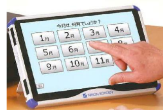
<物忘れ相談プログラム>