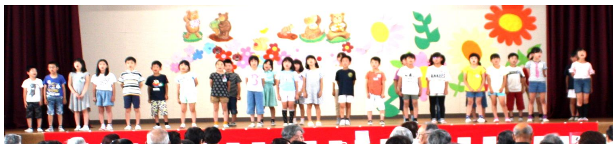
詩「たんぽぽ」、合唱「ともだち」