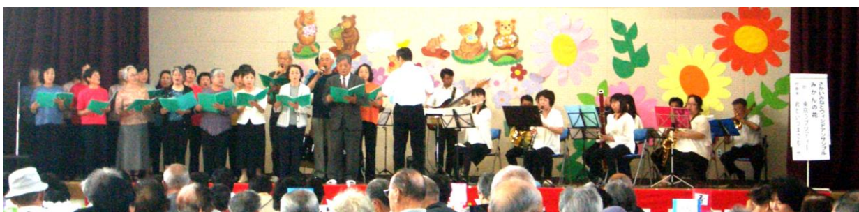
「東京ラブソディー」、「君といつまでも」、「渡中学校校歌」、など