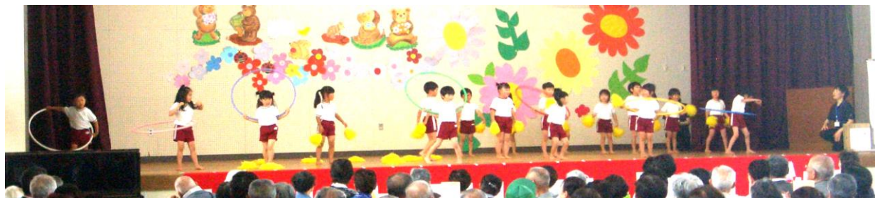
フラフープやポンポンを使った踊り「この木なんの木」