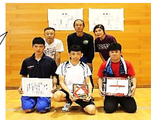
Bコート優勝 8区チーム