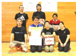
Aコート優勝 夕日ヶ丘チーム

7月7日(日)に渡体育館で「ワンバウンドふらばーるバレーボール大会」が開催されました。初めての大会であり、バレーボール型のスポーツですが、変形のボールを使う競技のため、ボールが飛ぶ方向の予想がつかず、最初は皆さん思った以上に苦戦しておられました。勝ち進んだチームは慣れてきたのか、だんだんと上手にラリーが続くようになりました。