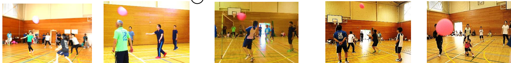
※大変暑い中、白熱した試合をされていました。参加された皆さん、お疲れ様でした。