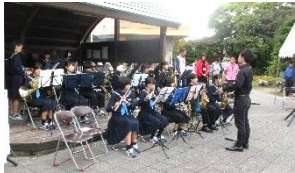
境三中 吹奏楽部さんによるオープニング演奏により元気にスタート!!