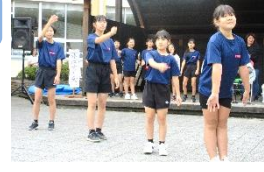
外江こども園さんとママさんズルさんのコラボレーション♪