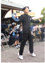
一番の盛り上がりを見せてくれました