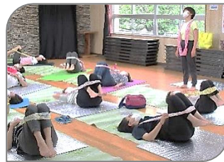
▶ 脱力させてコリをほぐしています