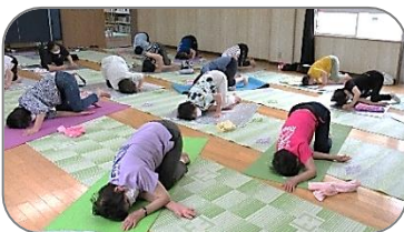
輪っかタオルを使った動作▶

輪っかタオルを使って、関節や背骨、骨盤の歪みやズレを矯正していきました。輪っかタオルを使うので負担が無く支えてくれるので、イタ気持ち良かったです。