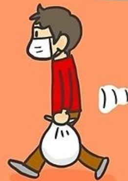
⑤掃除・ゴミ出しの後