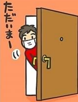
①外出先からの 帰宅