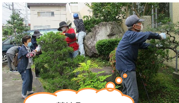
蓮池町 松本 隼人先生