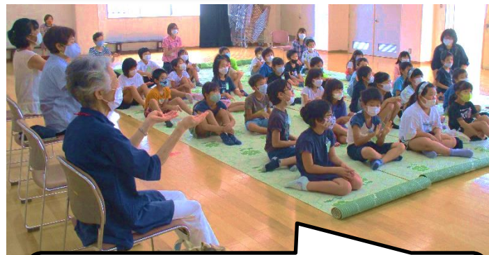
お話しポケットの皆さんと手遊び歌の手拍子をして楽しんでいます(^)/

お話しポケットさんの手遊び歌から和気あいあいと、子ども達も手拍子をしながら始まった。その途中で人形劇や手遊び歌が入るとお話しポケットさんに合わせて楽しそうに真似をしていた。合計12個のお話しがあったが、「走れ機関車・ちからあし」と「平和ってすてきだね」が印象的で子ども達は聞き入っていた。帰り際「次は冬休みお話し会で逢おうね」と笑顔で帰って行った。