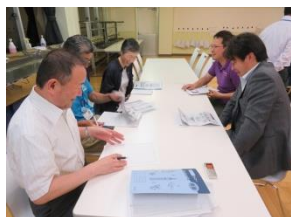
一中校区CSコーディネーター

www.torikyo.ed.jp/sakai1-j を開き、メニューの「コミュニティ・スクール」をクリックしてください。両小学校のホームページもぜひご覧ください。