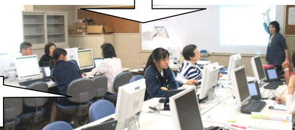
ワクワク境港 境一中の皆さん