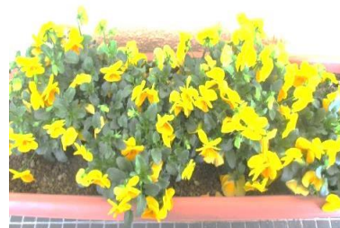
こんなにきれいに咲きました

毎年頂いています。 公民館玄関前で、きれいに咲いています。 毎日水遣りと手入れをしています。 ありがとうございました。