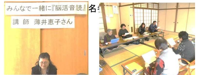
先生よろしくお願いします