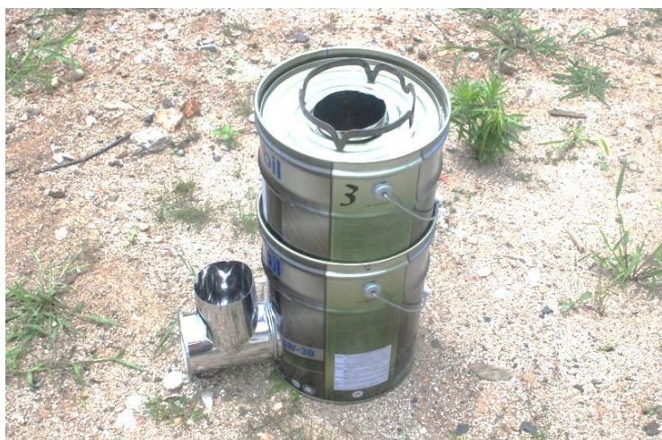
ロケットコンロ 試運転

初期消火では、参加した全員が水消火器の使い方を聞き、実際に放水作業を試みました。