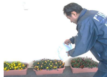
水分補給は欠かせません (I氏)