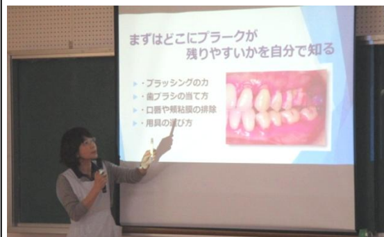
高場歯科衛生士による ブラッシング指導