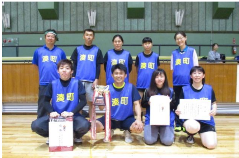
優勝の湊町自治会Aのみなさん