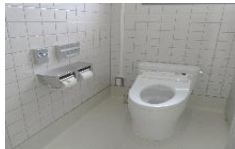
本館男子トイレも洋式に！

昨年末より本館1階トイレ及び集会所のトイレ改修工事に伴い、利用者の皆さまに大変ご不便、ご迷惑をおかけし申し訳ございませんでした。3月に入り新しいトイレがやっと完成しました！長期間にわたりご協力いただき、ありがとうございました。