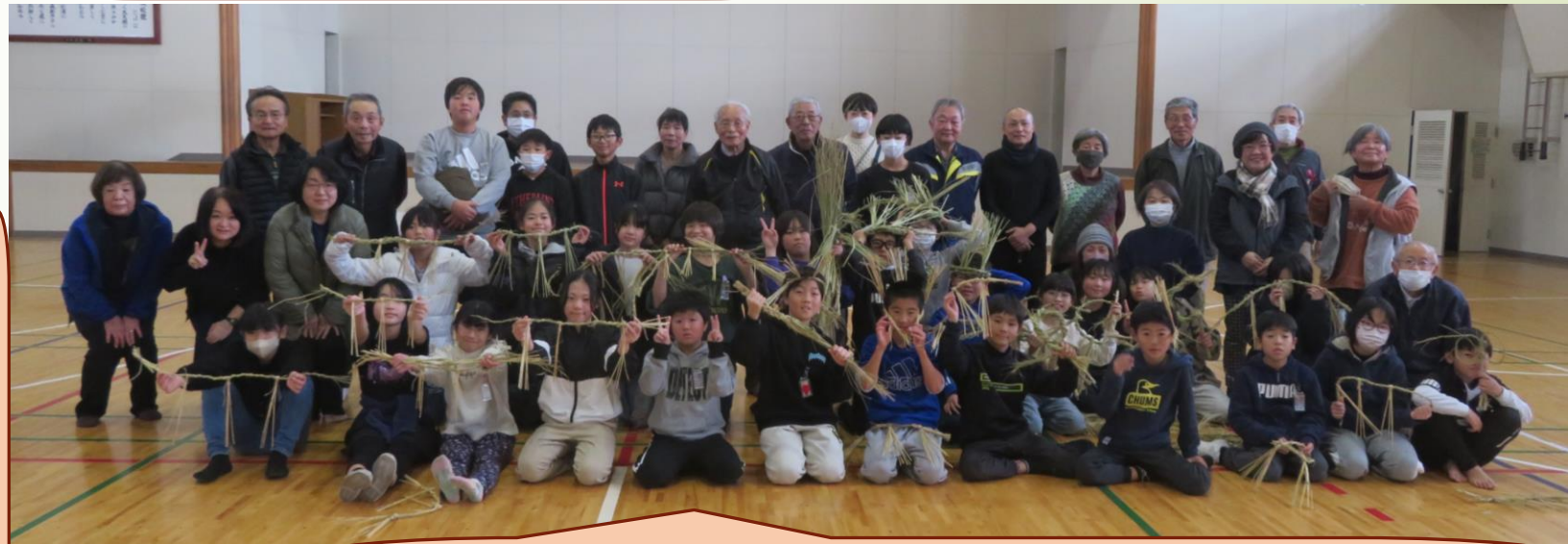
新年を迎える準備ができました(≡⊙> ∪ <⊙)。✧♡