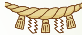
地域の方から藁をいただきました。