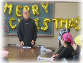
スポンジケーキについての ミニ講義をする館長さん