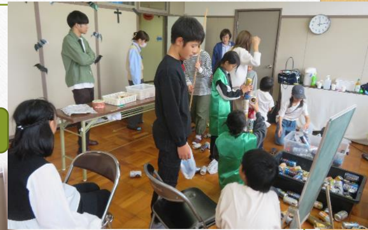
空き缶つみは児童がおおいに盛り上がりました。