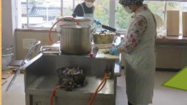
中学生ボランティアの昼食は地域の方々の協力でカレーを作っていました。