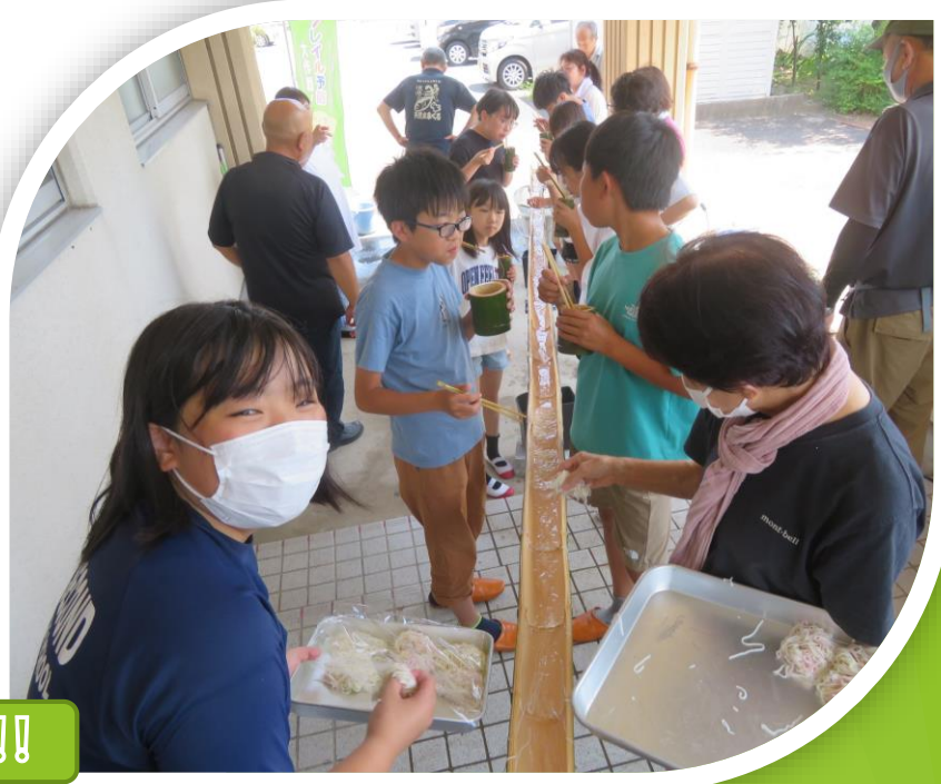
最後の片付けも自分たちで!!