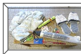
傘、ジャンパー、スリッパなど、当日の忘れ物を預かっています。来年1月末までに取りに来てください。