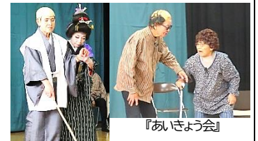
『あいさつ会』会場は笑いの渦に包まれていました。