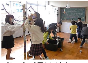
『ヤンプロ』企画の空き缶タワー