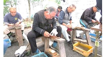
包丁研ぎは大好評で、順番待ちの列ができました。