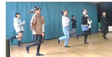
中浜小のダンスは、流行り曲で盛り上がりました。