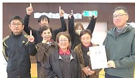
優勝した財ノ木町チーム！