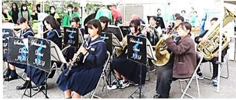
オープニングにさわしい演奏でした。見覚えのある姿も…

10月29日(日)に、境二中吹奏楽部の演奏や自主講座の方々と小学生による銭太鼓の演舞で公民館まつりの幕が開きました。スタッフや参加者、来館者の熱気(?)雨雲からお日さまも顔を出し、館庭で行われたメダカすくい、包丁研ぎ、恒例の当てくじやバザー也大盛況でした。集会所では、今回が初参加の自主講座の方々による落語、児童・生徒によるダンス、児童の書道パフォーマンスなどを含めた演芸発表は立ち見がでるほど盛況でした。栄養バランスチェック・フレイルチェックでは、普段摂取している食事のことや自分の筋力や健康状態を知ることができました。また、中高生・大学生や若者が、世代を超え地域の人々のつながりを求めて企画したモルックや空き缶タワー、e スポーツの体験は子ども達の人気を集めていました。「今年は賑やかだったね～」と数多くの声をきき嬉しく思いました。地域の方々には、メダカや野菜をたくさん提供していただいたり、ボランティアに参加して下さったりしていただきありがとうございました。