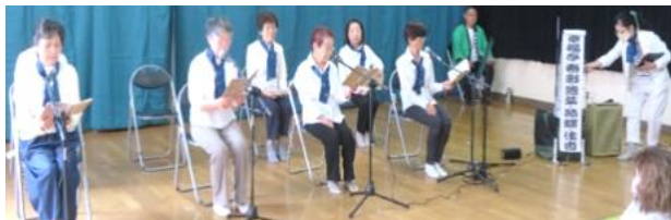
『しあわせ音読』は役割分担をして落語を披露