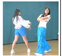
決めポーズもバッチリ!