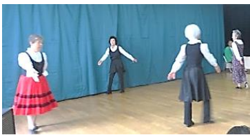
素敵な衣装の『フォークダンス』