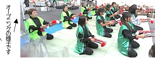
オープニングの様子です