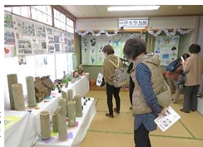
来館者の目を惹きつけてくれました。各ブースの数々の作品は、