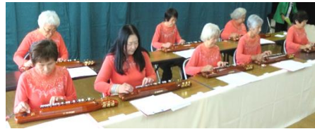
自主講座の『大正琴』による演奏に口ずさむ姿も…