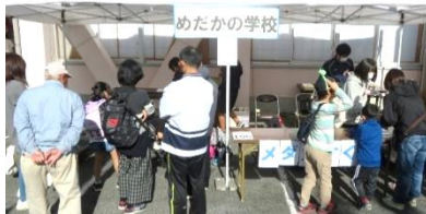
ボランティアが全偉!