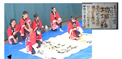
本番に向けて腕を磨いた書道パフォーマンス。感動しました!作品は、公民館玄関に展示しています。