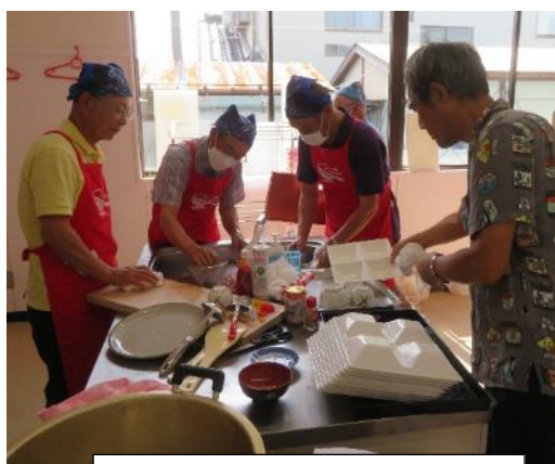
後片付けまでしっかりと！

「ポリ袋クッキング」とは、耐熱性のポリ袋に、材料を入れてよく混ぜ、袋のまま鍋で湯せんする料理方法です。今回は、この方法で「やさいオムレツ」を作りました。 ふわふわのオムレツが美味しく出来ました。