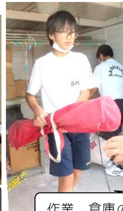
作業 倉庫の片付け