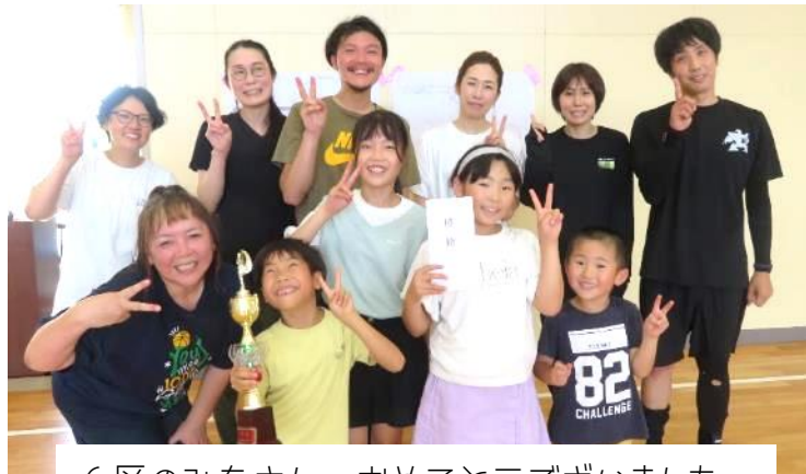
6区のみならず、おめでとうございます。