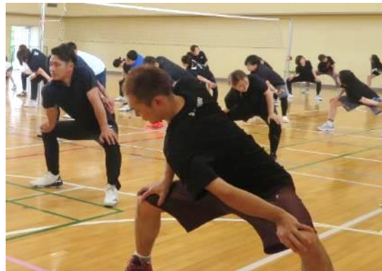
怪我のないようしっかりストレッチ！

体育会の役員のみならず、大会の準備や片付けなど、早朝よりお世話になりました。ありがとうございました。