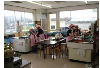
食生活改善推進委員 「そば処」