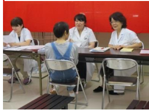
鳥取県薬剤師協会 「お薬相談コーナー」