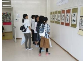
一般作品「子ども書道」