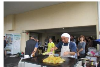
青少年育成境地区部会「焼ソバ」