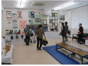
ふれあいの家(東・中・西)