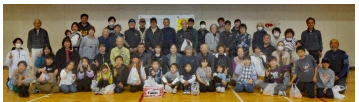
優勝…幸神町Aチーム 準優勝…小篠津町B・財ノ木町チーム 3位…夕ヶ丘1町丁目Aチーム

子どもから高齢者の人たちが、世代を超えて楽しいひと時を過ごし、ふれあいを深め地域のつながりをつくることができました。