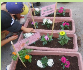
最後に、名前の書いてある手作りの旗を添えました。そこには「大きく育てね」など花に対するやさしい思いが書いてあります。

中浜公民館運営審議会委員(公運審)の福祉部が中心となり、『緑の募金』を活用して、地域の方と中浜小3年の児童たちと一緒に花の苗植えを行いました。