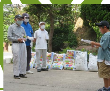
児童を代表して、立派なあいさつができました。