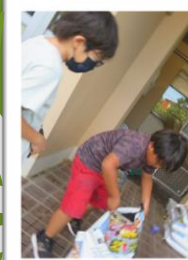
一人でだいじょうぶ！