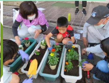
豊てっ…手伝おうか？