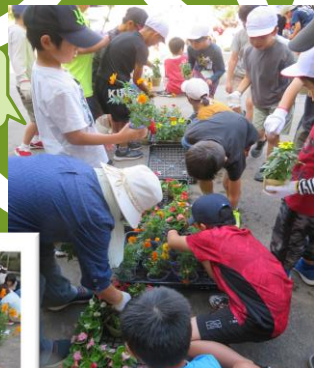
赤い花にしようかな～？